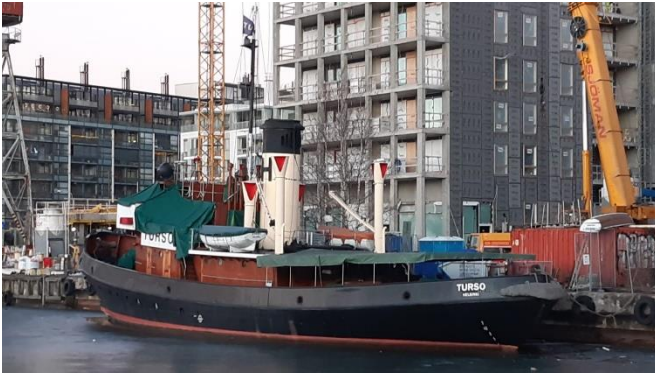
Turso Hietalahdessa 17.12.2021