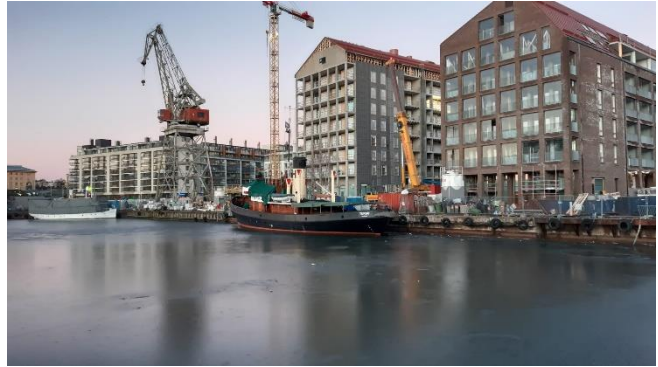
Hietalahden laituri 17.12.2021