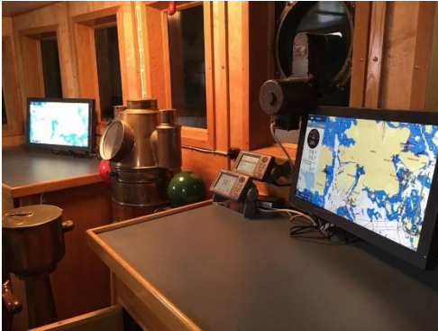
Turson komentosilta 2.5.2020

Turso on seissyt Korona epidemian takia laiturissa lokakuun lopusta 2019 lähtien ja samoin tilanne on ollut kotisivuilla näkyvien jäsentiedotteiden osalta, edellinen päivitys oli 1.8.2019. Luonnollisesti normaalia tiedottamista kuitenkin on jäsenistölle hoidettu, lähinnä tapaamisten ja sähköpostien välityksellä. Kotisivuille on tehty myös selkeyden vuoksi muutamia muutoksia. Otsikko Info on muutettu ”jäseneksi” otsikoksi, koska sivun kautta lähetetään jäsenhakemukset. Jäsentiedotteet on muutettu ”jäsenille” otsikoksi. Media osioon on lisätty artikkeleita Turson vaiheista vuodesta 2004 lähtien. Alla lisäksi lyhyesti yhteenvetoa kahden vuoden aikana tapahtuneista keskeisistä seikoista Tursoon ja perinnelaivalaituriin liittyen.