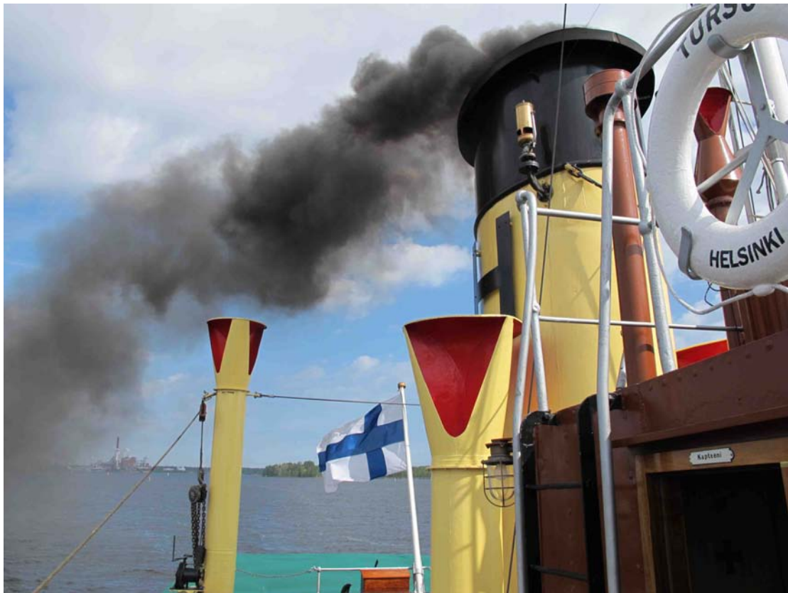
Turso savuaa ulos Kotkasta.

Maanantaiamuna matka jatkui Kotkasta Santion merivartioasemalle, josta passintarkastuksen jälkeen Turso höyrysi harmaassa säässä ja sateessa Venäjän vesille. Oli jo alkuiltä, kun Vihrevoin, entisen Tuppuran edustalla venäläinen luotsi nousi Tursoon ja ohjasi sen Vysotskin eli Uuraan kauniiseen salmeen. Sieltä Viipurinlahdelle tultua alkoi jo Viipurin linnan tuttu torni näkyä taivaanrannalla. Ilta oli jo myöhä, kun Turso lopulta kiinnittyi Eteläsataman hiililaituriin.