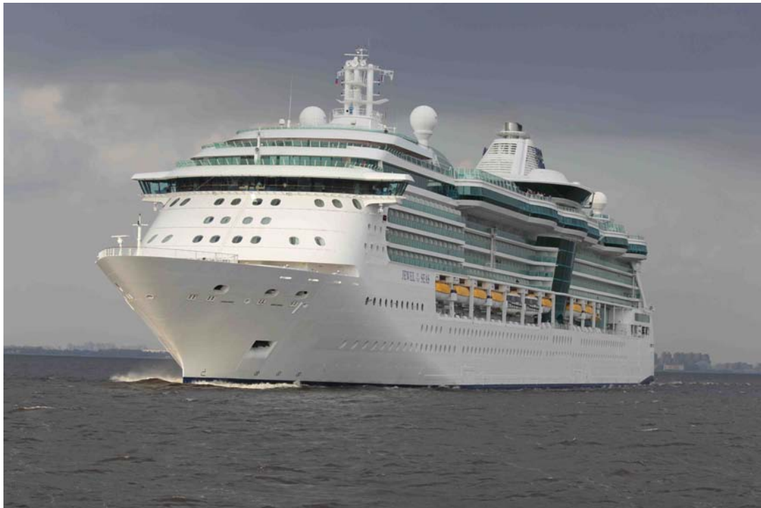
Jewel of the Seas.

huomionosoituksesta. Tämä show jatkui sitten 12 kertaa saattueen jokaisen laivan kohdalla.