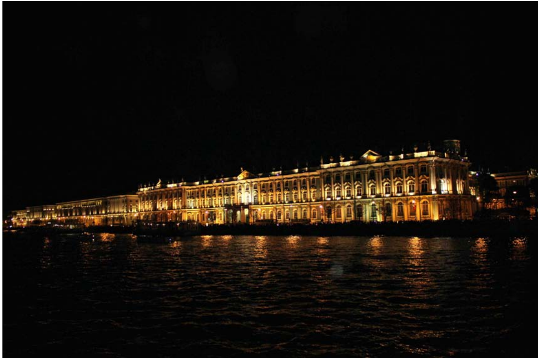
Talvipalatsi valaistuna yöllä.

Neva on Aequatoriumin kohdalla niin leveä, että muuta laivaliikennettä häiritsemättä suomalaislaivat saattoivat ankkuroida Pietari-Paavalin eli sikäläisittäin Petropavlovskin linnoituksen eteen. Lyhyt, mutta vaikuttava purjehdus oli tehty.