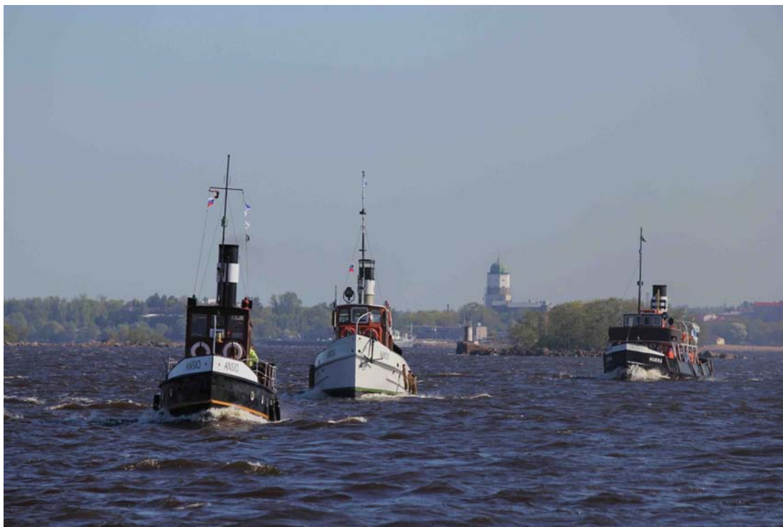
Anso, Ahti ja Hurma 1 ja Viipurin linna.

Tiistaiamu valkeni Viipurissa aurinkoisena, mutta navakka lounaistuuli sai pienet Saimaan hinaajat melkoisesti keinumaan jo Viipurinlahdella. Hiukan myöhästynyt pietarilaisen NTV Novotnyn kuvausryhmä kastui jo tullessaan kumiveneellä Tursolle. Saattue oli jaettu kolmeen ryhmään, joista jokaiseen tuli yksi luotsi, ensimmäinen tietenkin johtoalus Tursoon. Vihrevoimien jälkeen käännyttiin kaakkoon ja nyt pienet laivat alkoivat kunnolla rullata, ennen kuin päästiin Koiviston salmeen ja Piisaaren suojaan.