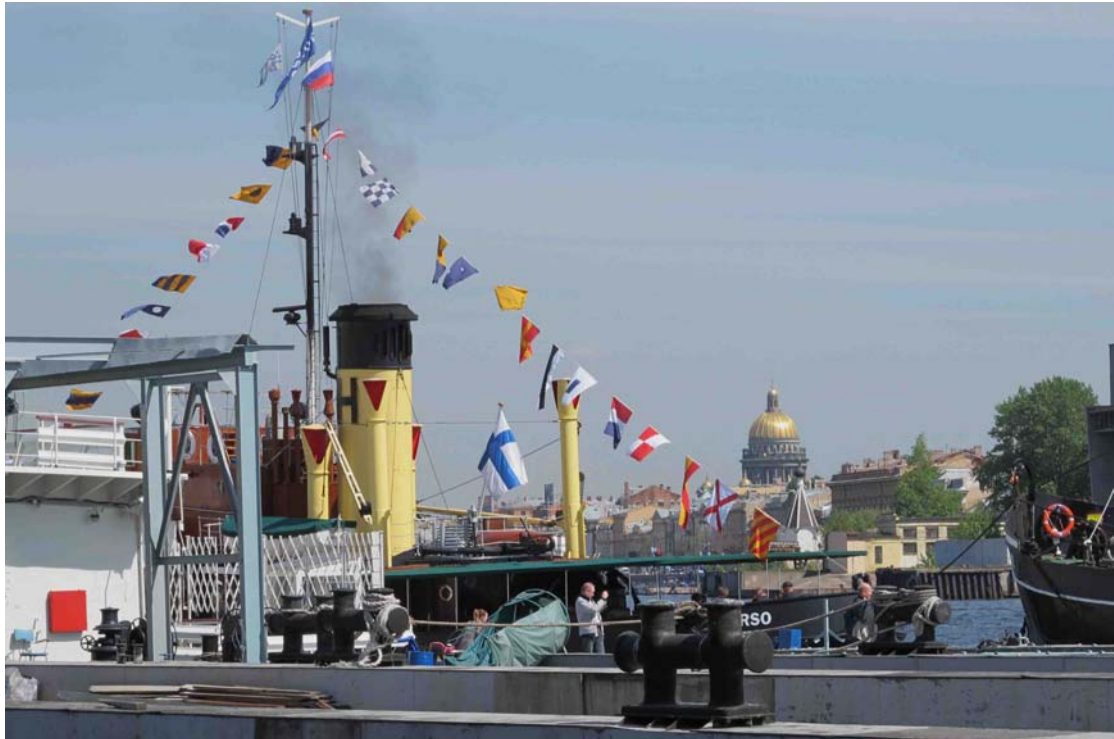
Turso ja lisakin kirkko.

Hiljalleen alkoi paljastua, että media, TV ja paikallinen sanomalehti olivat tällä välin kertoneet Tursosta, sillä edellispäivästä poiketen laiturille alkoi tungeksia uteliasta väkeä. Kaikki halusivat nähdä, millaiseksi ”heidän vanha Taifuninsa ” oli muuttunut Suomessa. Katsojia oli niin paljon, että heidän pääsyään laivalle piti rajoittaa vain parhaimmat perustelut kertoville. Muutama mies kertoi olleensa aikoinaan töissä Taifunilla, mutta heidän haastattelemisensa tyrehtyi valitettavasti yhteisen kielen puutteeseen. Meriakatemian oppilaita tuli pitkin päivää Tursoa katsomaan ja heidäthän piti ilman muuta ottaa vastaan. Erikoisimpia vieraita oli Pietarin tunnetuin hääkuvaaja ja vihkipari, jotka halusivat erikoisia kuvakulmia varten päästä kiertelemään Tursolle.